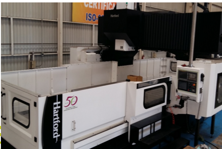
Centro de maquinado vertical CNC HARTFORD PRO-3210SG