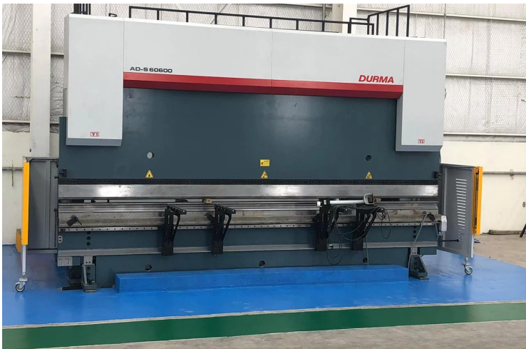
Prensa CNC DURMA AD-S60600