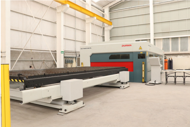
Laser CNC DURMA HD-F 6025 de 8 KW