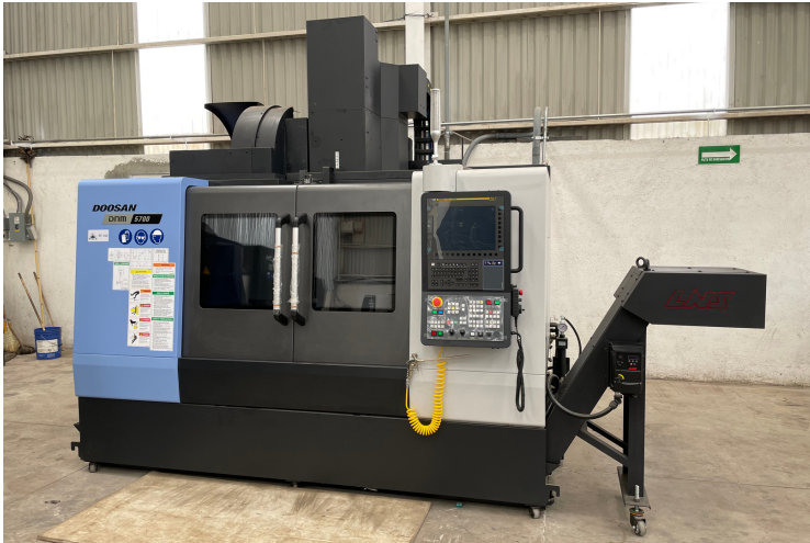
Centro de maquinado vertical CNC DOOSAN DNM 5700