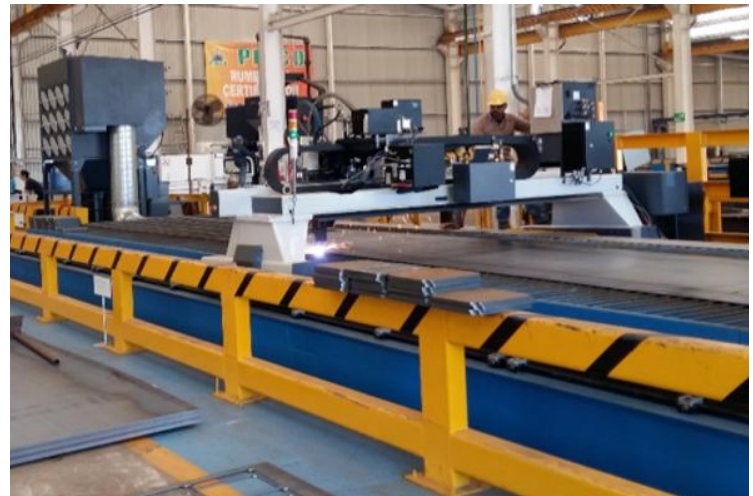
Plasma CNC HYPER THERM Pro-Arc