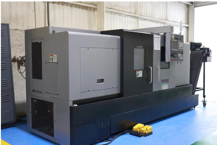
Centro de torneado vertical CNC TAKISAWA LA- 300-2