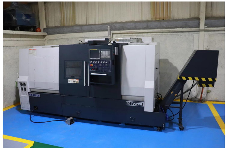
Centro de torneado vertical CNC VIPER VT-28BL