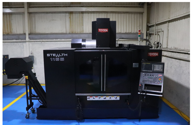
Centro de maquinado vertical CNC TOYODA WELLE AA1165G