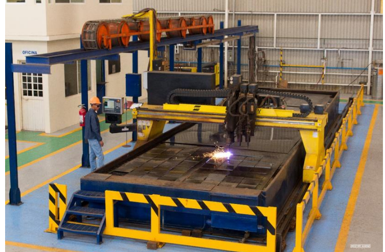
Plasma CNC ESAB Avenger X P2 4000