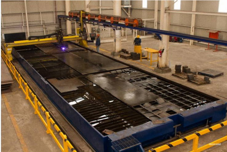
Plasma CNC ESAB Avenger 6500