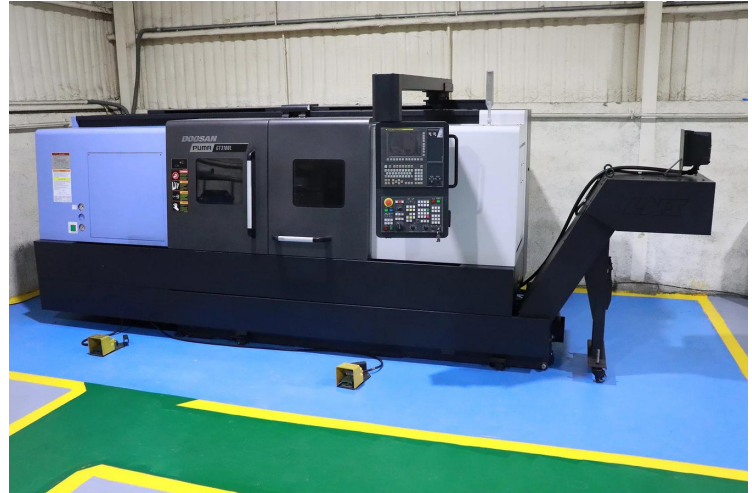
Centro de torneado vertical CNC DOOSAN PUMA GT3100L